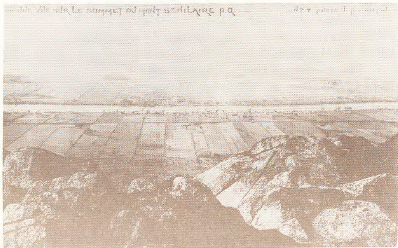
Le village de Beloeil, vu du mont Saint-Hilaire, au début du siècle.