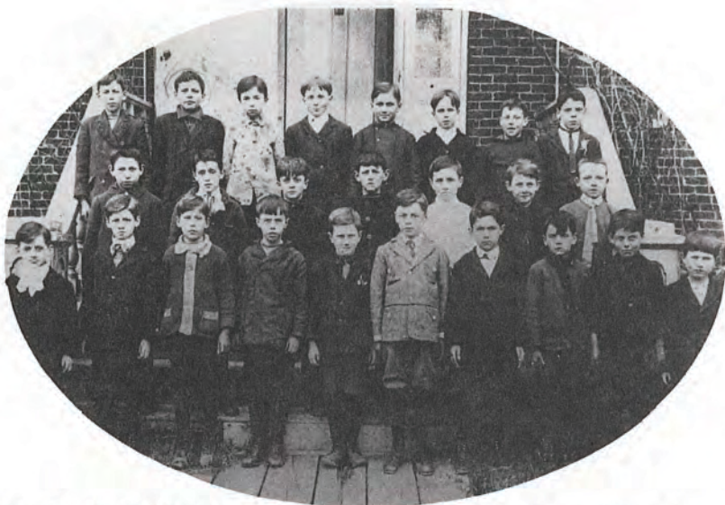
19. LES ÉLÈVES DES FRÈRES MARISTES , vers 1905, au village de Beloeil.