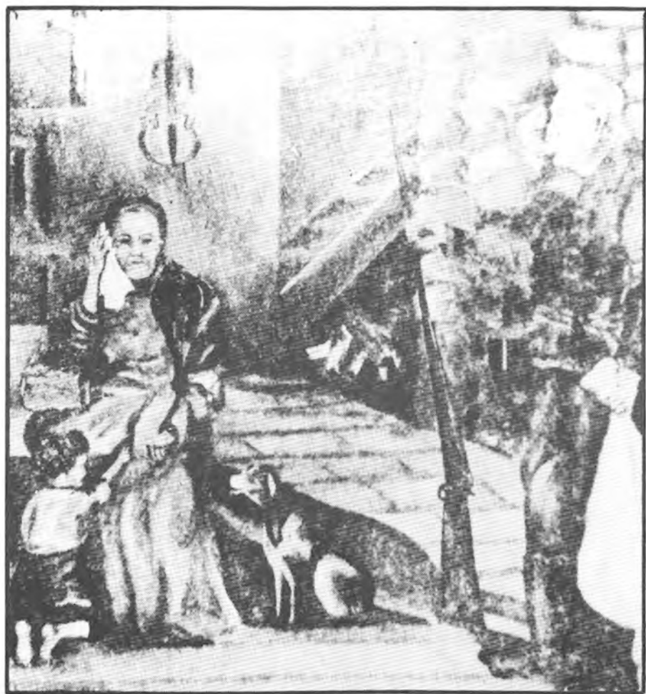
« Le départ du patriote », Détail d'un dessin de J.-M. Lemelin tiré de Amiel, un patriote ignoré de '37 , Montréal, 1938, page 1. Radio-roman à la mode en 1937. Reproduit en page 137 de Robert-Lionel Séguin, L'Esprit révolutionnaire dans l'art québécois , Album contenant 265 illustrations, publié aux Éditions Parti Pris, Montréal, 1972.