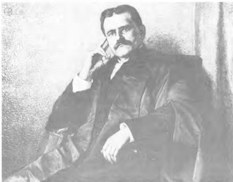
Portrait de l'honorable Louis-Philippe Brodeur par Ozias Leduc, peinture à l'huile exécutée en 1904 (Chambre des Communes, Ottawa).

1890: La fabrique construit une maison pour le bedeau, dans le cimetière. C'est un cas unique au pays parce qu'une partie de la maison sert de salle publique pour le conseil municipal et les commissaires d'écoles, tout en demeurant propriété de la fabrique 25 . Cette construction est le premier hôtel de ville de Saint-Hilaire. En 1967, la dite maison, convertie en résidence, est transportée rue Plante, après avoir servi les intérêts des administrés durant 77 ans.