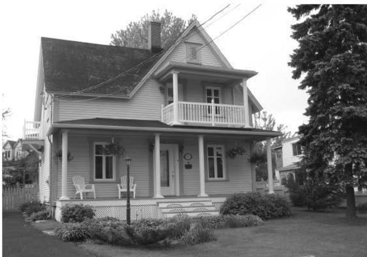
Figure 1 . Maison sise au 932 rue Richelieu à Belœil.

Dans un article sur Les Veillées du Père Bonsens 1 , titre d'un journal édité par Napoléon Aubin au cours des années 1865-1866, Pierre Lambert nous apprenait qu'Aubin, journaliste en vue du Bas-Canada, habitait alors à Belœil au moment où il éditait ce journal à la fin de l'automne 1865. Jean-Paul Tremblay, principal biographe de Napoléon Aubin, précise également que ce dernier s'établit à Belœil en 1864, après un séjour d'une dizaine d'années aux États-Unis 2 .