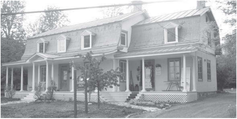
Figure 3. Maison Joseph-Daigle, sise au 910 rue Richelieu.

Deuxième maison de Belœil à être habitée par Napoléon Aubin de mars 1863 jusqu'à son départ en 1866.