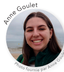
Anne Goulet

La chronique paraît le dernier mercredi de chaque mois.