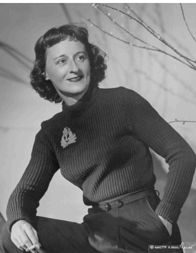
Photographie de promotion fournie lors de la publication de Mathieu, 1949