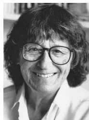
Françoise Loranger, s.d.

dans des revues aussi diverses que la Revue populaire , le Bulletin des agriculteurs , la Revue moderne ou le Quartier latin où son style élégant et précis lui attire l'intérêt des lecteurs. Vers 1939, encouragée par Robert Choquette, elle écrit des scénarii pour la radio. Son premier roman, Mathieu , paru en 1949, est très bien reçu et devient un classique de la littérature québécoise. Par l'entremise de son héros, l'auteure explore la quête de soi et le désir de dépasser sa condition sociale sans se soumettre aux diktats de l'Église et de la société.